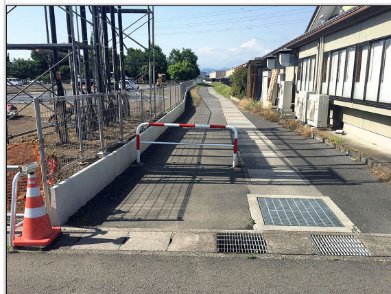
19 申請地東側道路境界部