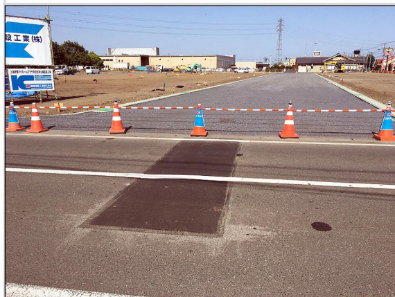
05. 下水道接続部と舗装復旧工事