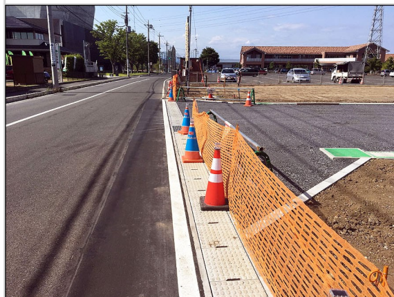
03. 道路側溝の新設と影響部舗装