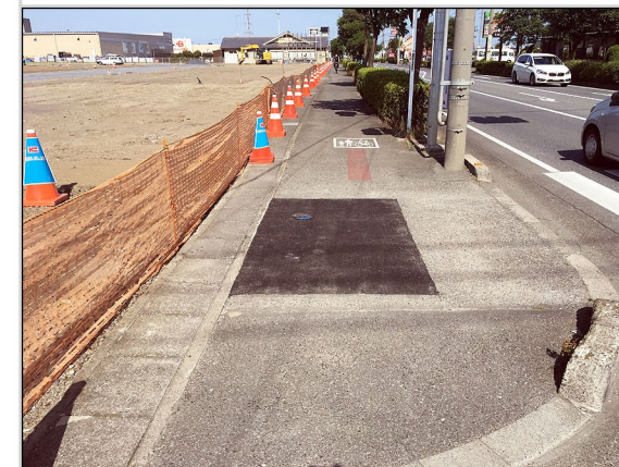
13. 水道取出工事部と舗装復旧工事