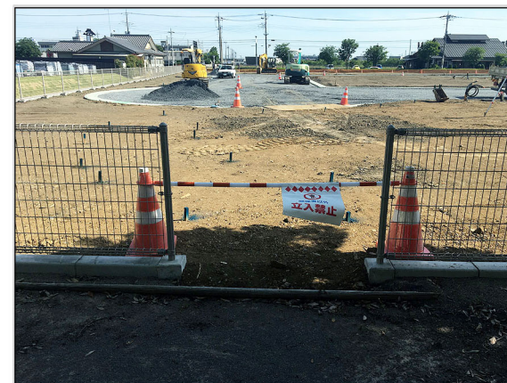
25 申請地北側フェンス開口部