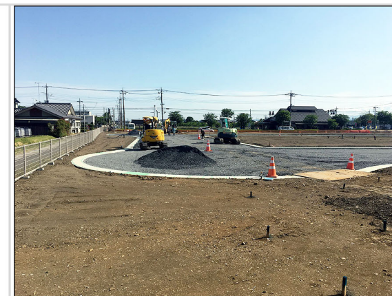
26 構内道路路盤工事