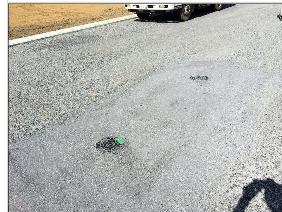
29 構内道路上の下水道マス