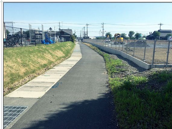
22 申請地南東道路境界部