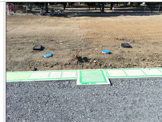
30 構内道路側溝用の泥溜マス