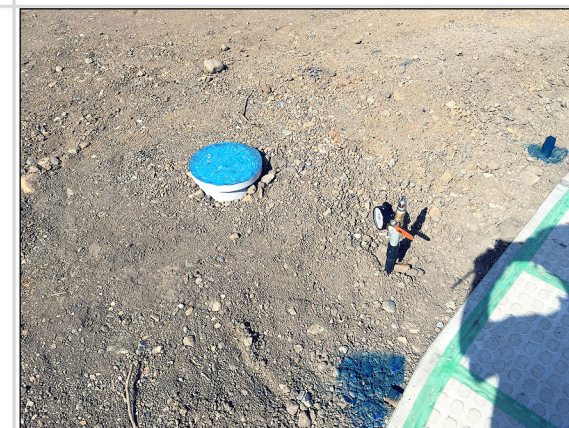
28 各区画の公共下水マスと水道引込