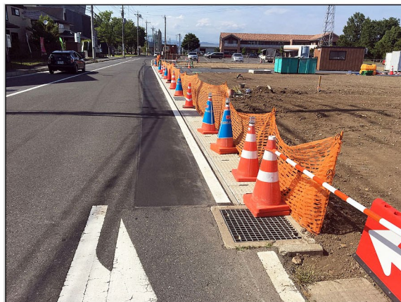
01. 道路側溝の新設と影響部舗装