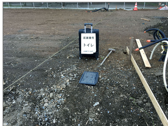
給水ボックス・下水最終宅内マス設置状況