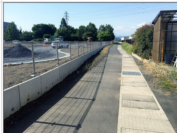
20 申請地東側道路境界部