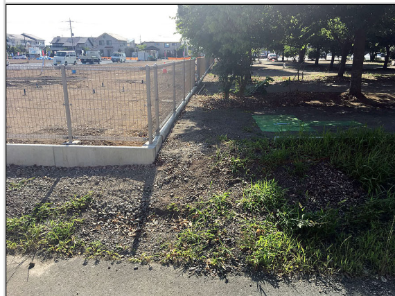
23 申請地南東道路境界部