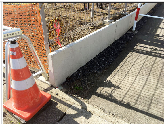
18 申請地南東道路境界部