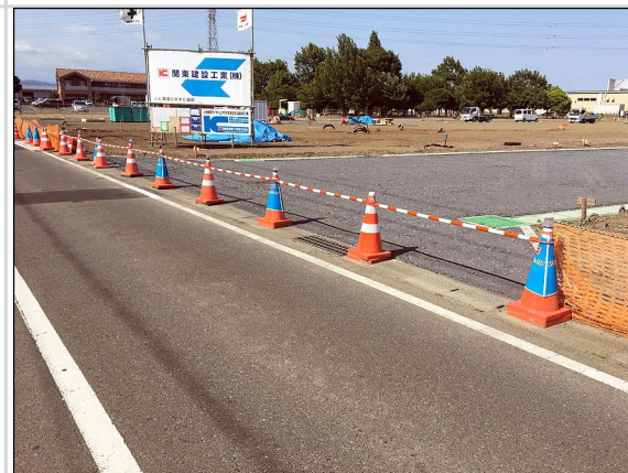
06. 構内道路と公道の交差点