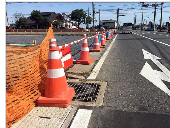
11. 道路側溝の新設と影響部舗装