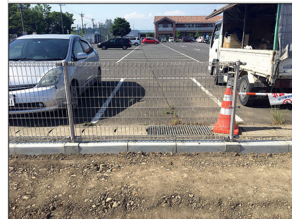
31 北側隣地境界部の縁石及びフェンス