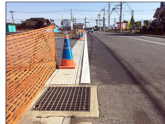
09. 道路側溝の新設と影響部舗装