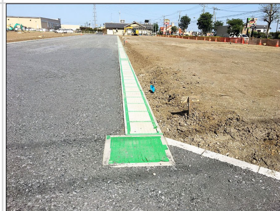
04. 構内道路の側溝布設と路盤工事