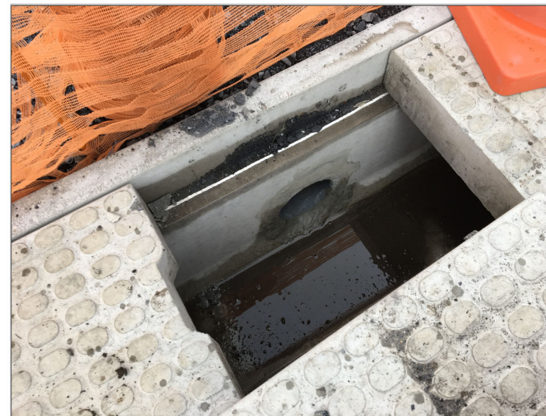
2級31号線（太田市民会館側道路） の道路側溝への雨水排水放流部 北から2番目の放流箇所