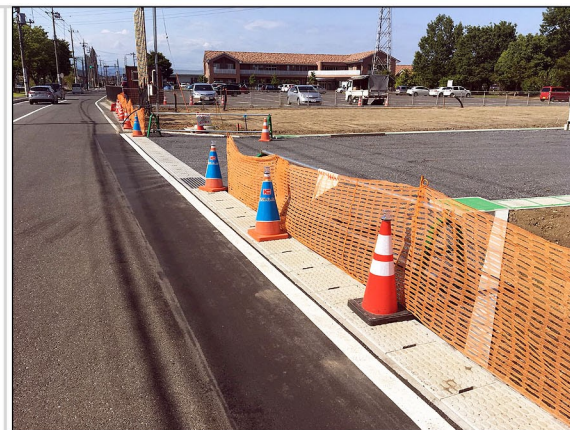
02. 道路側溝の新設と影響部舗装