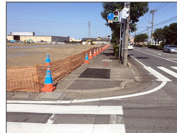
15. 申請地南西の交差点角