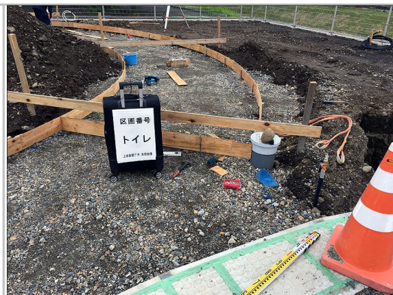
給水ボックス・下水最終宅内マス設置状況