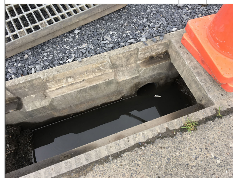
2級31号線（太田市民会館側道路） の道路側溝への雨水排水放流部 北から4番目の放流箇所