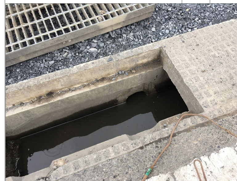
2級31号線（太田市民会館側道路） の道路側溝への雨水排水放流部 北から3番目の放流箇所