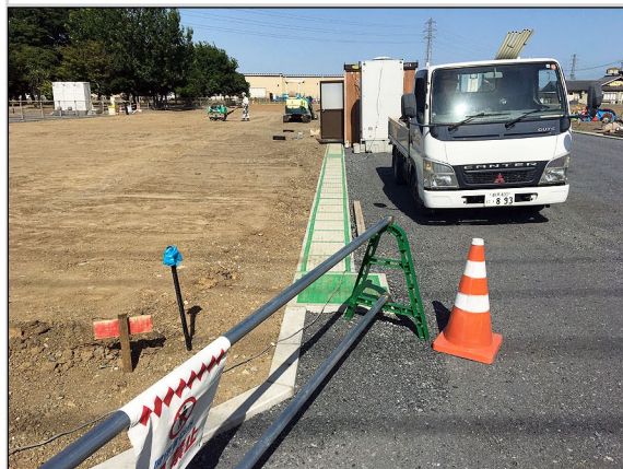
07. 構内道路側溝の敷設工事