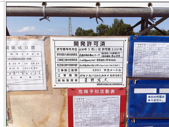
32 開発許可表示看板の掲示状況