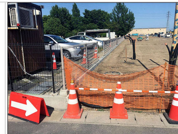
10. 北側隣地境界及びフェンス設置