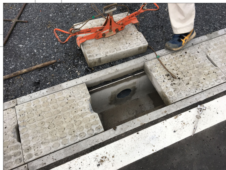
2級31号線（太田市民会館側道路） の道路側溝への雨水排水放流部 北から1番目の放流箇所