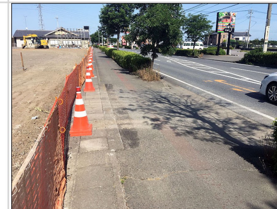
16. 申請地南側の道路境界