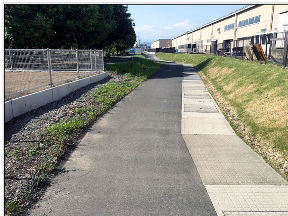
21 申請地東側道路境界部