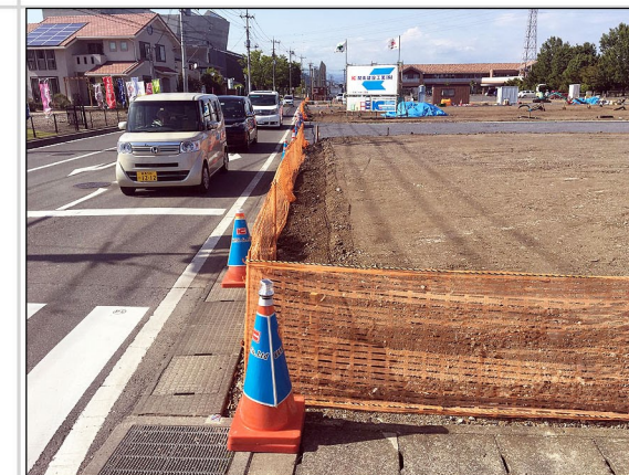
12. 申請地南西の交差点角