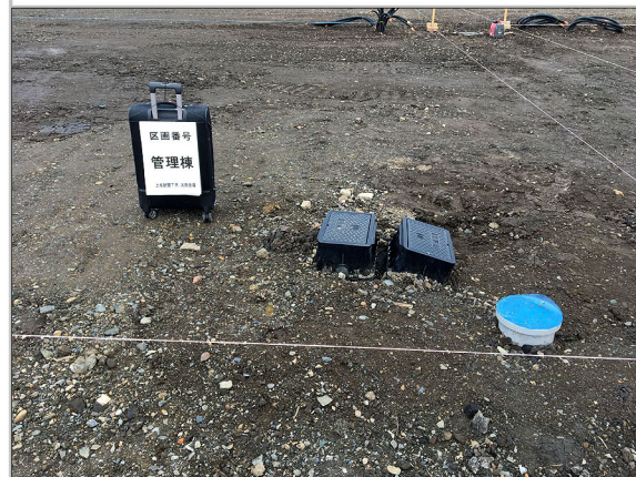
給水ボックス・下水最終宅内マス設置状況