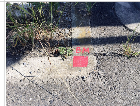
14. 仮ベンチマークの位置