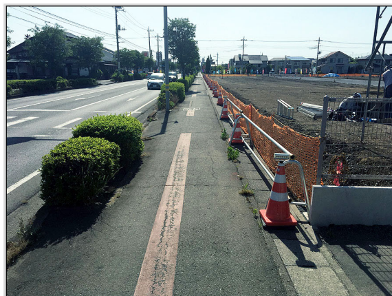
17 申請地南東道路境界部