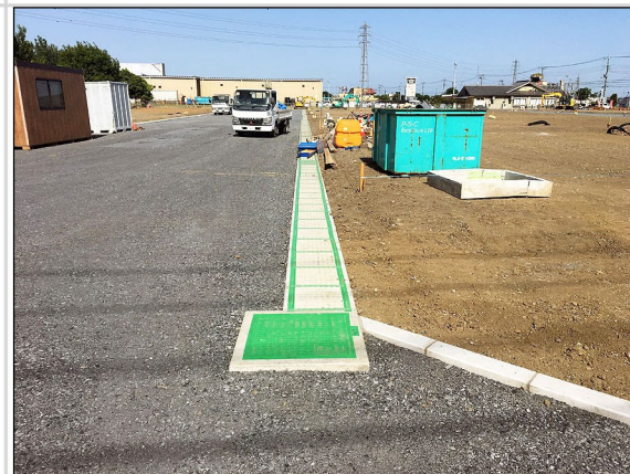
08. 構内道路側溝と最終マス