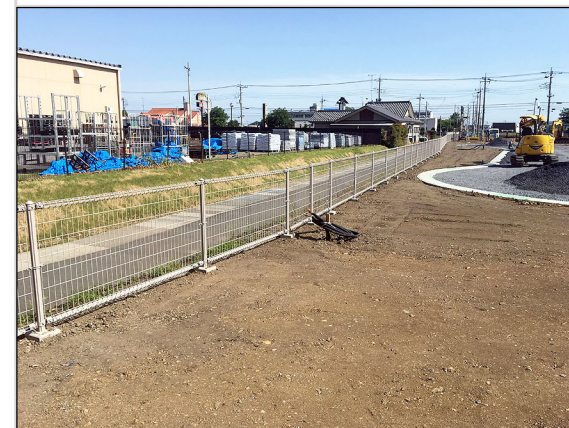
27 申請地東側道路境界とフェンス設置